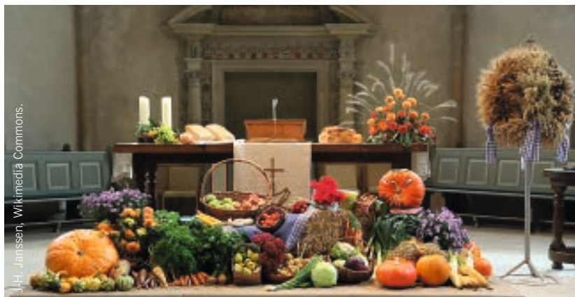
J.-H. Janssen, Wikimedia Commons

Das Erntedankfest findet in der katholischen Kirche meist am ersten Sonntag im Oktober statt. In einigen Teilen der Schweiz war es früher üblich, dass die Bauern ihre Mägde und Knechte nach dem kirchlichen Erntedankfest zu einem weltlichen Fest mit Musik, Tanz und üppigem Essen einluden. Aus Ähren wurde eine Erntekrone geflochten, die bis zum nächsten Sommer an den Schöpfer erinnerte, wie er im Psalm 65 beschrieben wird: «Du krönst das Jahr mit deiner Güte, deinen Spuren folgt Überfluss» (Ps 65,12).