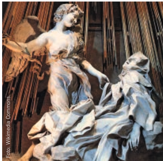
Die Verzückung der heiligen Teresa von Ávila, Gian Lorenzo Bernini, Santa Maria della Vittoria, Rom.

Nach der sogenannten «Höllenvision» (1560), wuchs in Teresa der Wunsch nach einem konsequenteren Leben in einer eigenen Gemeinschaft. Mit Hilfe des Bischofs von Ávila erhielt Teresa von Papst Pius IV. die Erlaubnis, in Ávila ein Kloster zu gründen, in dem wieder die ursprüngliche Ordensregel des heiligen Alberts von Jerusalem befolgt werden sollte. Am 24. August 1562 wurde ihre erste Gründung, der Convento de San José, in Ávila errichtet. Es folgten 16 weitere Gründungen für