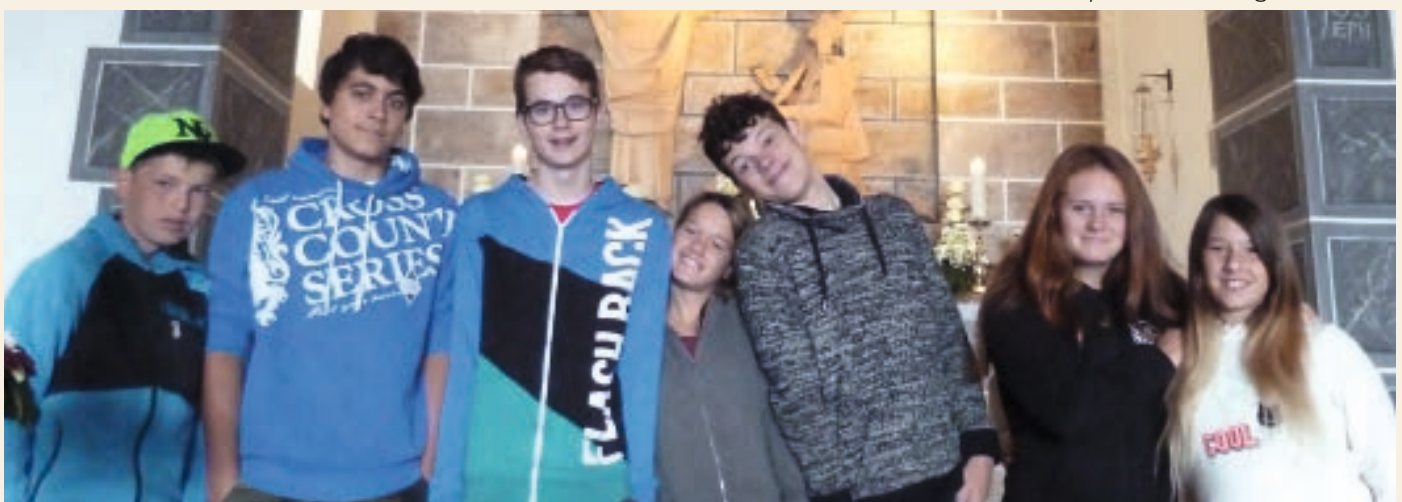
Die Ministranten hatten viel Spass am Ausflug nach Ziteil.