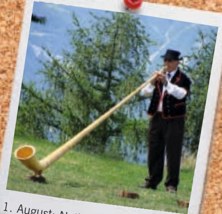
1. August: Nationalfeiertag