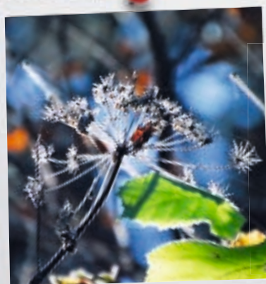
Wunderbar sind deine Werke... Psalm 139.146

... der 9. November der Weihetag der Lateranbasilika ist? Als Bischofskirche von Rom ist die Lateranbasilika die ranghöchste der vier Basilicae maiores Roms. Im 4. Jahrhundert entstand hier auf Befehl Kaiser Konstantins eine erste monumentale Basilika und ein dazugehöriges Baptisterium.