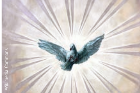
Il simbolo per lo Spirito Santo è la colomba. Pittura a soffitto nella Karlskirche di Vienna di Wolfgang Sauber (XVIII. secolo).