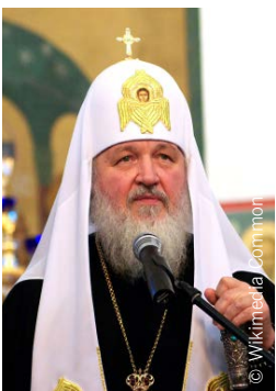
Patriarch Kirill I. von Moskau.

Russland erhält eine neue Landesverfassung. Staatspräsident Wladimir Putin hat darin den Gottesbezug vorgeschlagen.