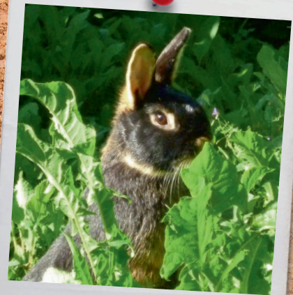
Frohe und gesegnete Ostern!

... der Weisse Sonntag seit 2000 auch als Fest der Barmherzigkeit Gottes begangen wird? Es ist der Sonntag nach Ostern und mit ihm endet die Osteroktav – jene acht Tage, die alle als Hochfest und mit Gloria in der Messe und Te Deum im Stundengebet begangen werden. Viele Kinder feiern an diesem Sonn- tag ihre Erstkommunion .