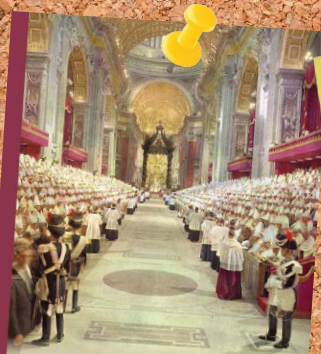
50 Jahre Zweites Vatikanisches Konzil

... die rätoromanische Home- page Pieval da Diu Vorberei- tungstexte für das jeweilige Sonntagsevangelium bietet? www.pieveldadiu.ch